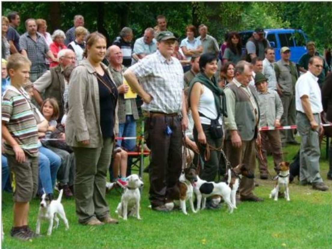
Jägervereinigung Pegnitz Hundevorführung