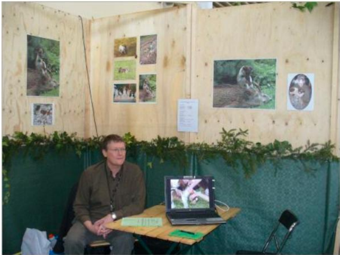
Foxterrierstand Jagen und Fischen München 2007