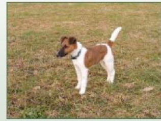
Vally von den Felsengärten: JP / BP sl / spl Formwert: SG 1

Im Alter von 9 Monaten erlangte sie bei der Bauprüfung nochmals den Suchensieg mit voller Punktzahl.